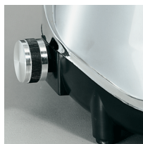
Variable speed device optional