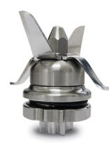
Removable s/steel knives assembly