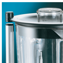
Microswitch on cover