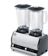
Orione 2T VV