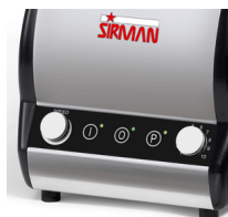
Orione Plus VV