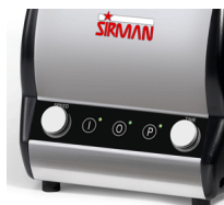
Orione Timer VV