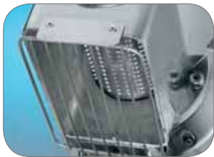
1. Griglia di protezione/Rullo inox di serie Protection grate/Standard stainless steel drum