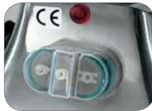
2. Opzionale: Pulsantiera con inversione di marcia Optional: Push-button panel with reverse