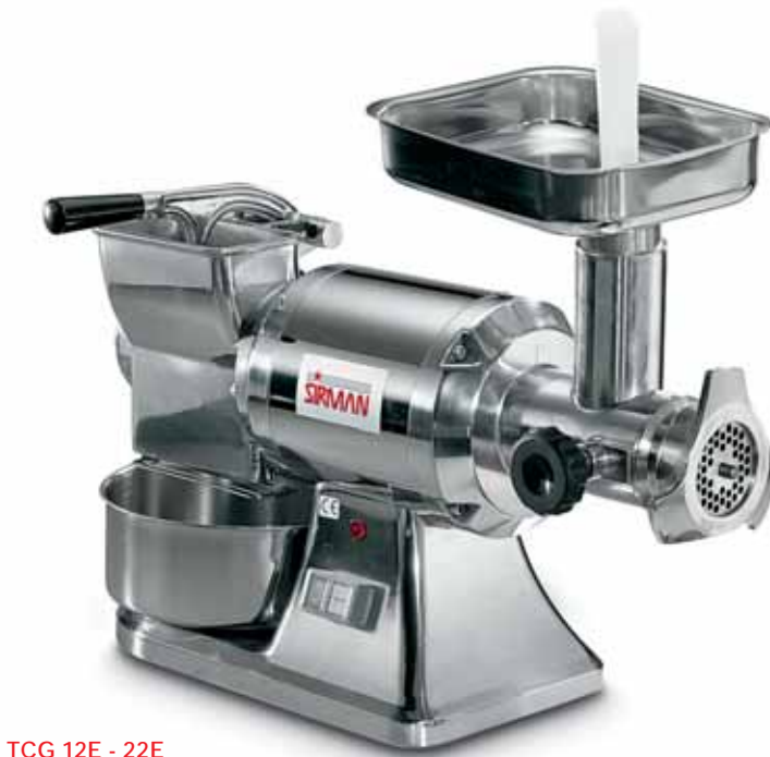
TCG 12E - 22E