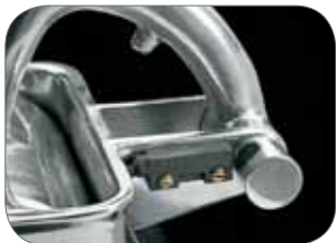
3. Microinterruttore su grattugia Microwitch on the grater