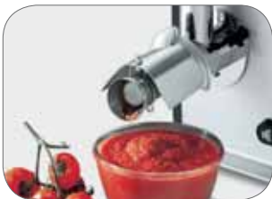
TCG 8 VEGAS