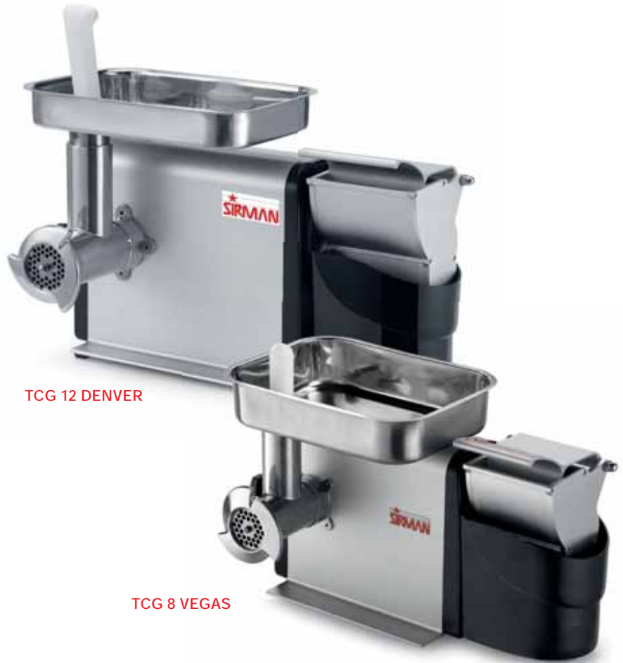
TCG 12 DENVER