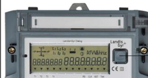
Кнопка опроса вниз