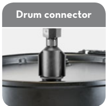
Code F19157000 Drum connector 2" BSP