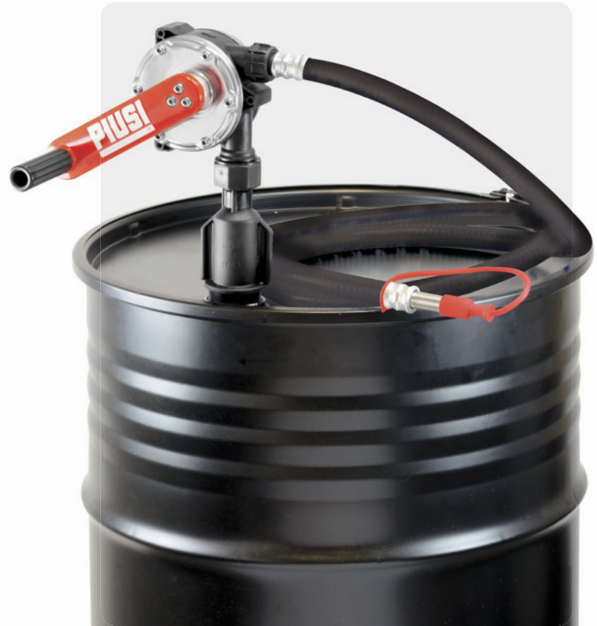
Rotative hand pump with delivery hose and stainless steel spout.