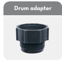
Code F15236000 F: 2" BSP - M: 56x4