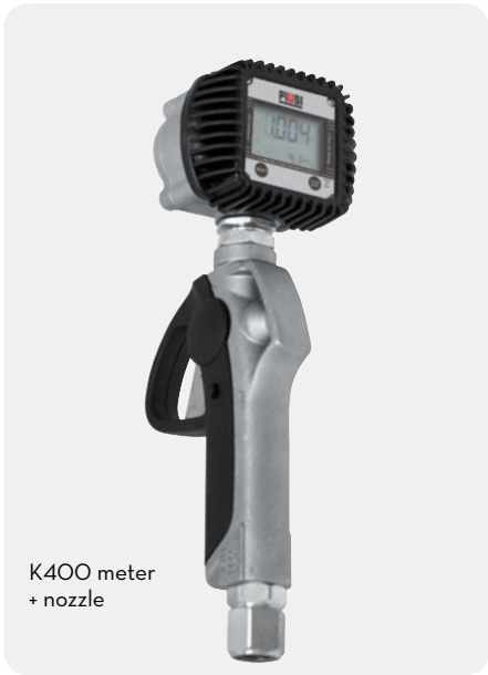
K400 meter + nozzle