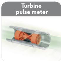
Turbine pulse meter