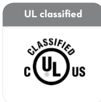
Class I Groups C and D