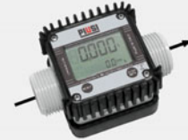
K24 ENO approved for wine and beer (on request)