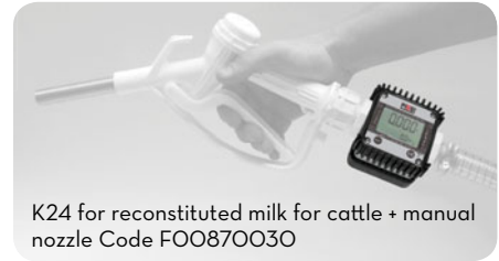
K24 for reconstituted milk for cattle + manual nozzle Code F00870030