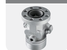
with integrated valve Code F17163000