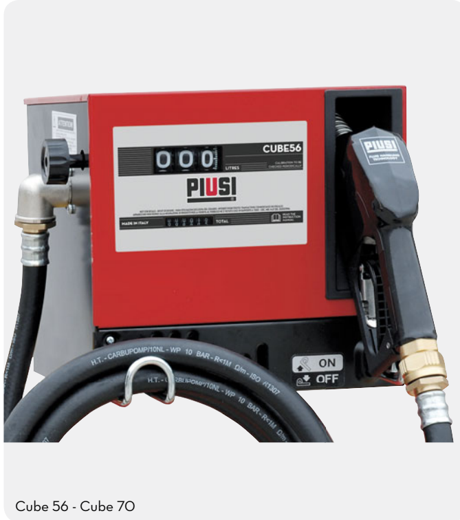
Cube 56 - Cube 70