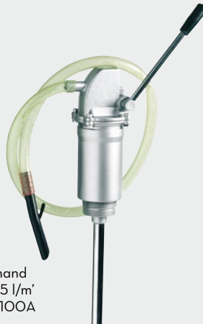
Piston hand pump 35 l/m' FOO35100A