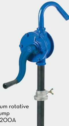
Aluminium rotative hand pump FOO33200A