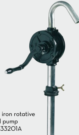
Cast iron rotative hand pump FOO33201A