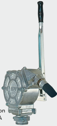
PM GPI Piston FOO31600A