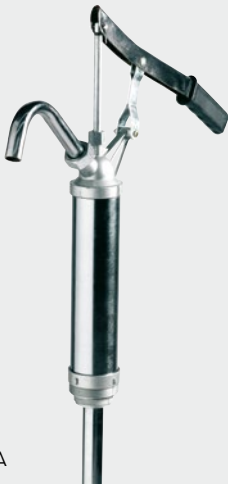
Piston hand pump 25 l/m' FOO34900A