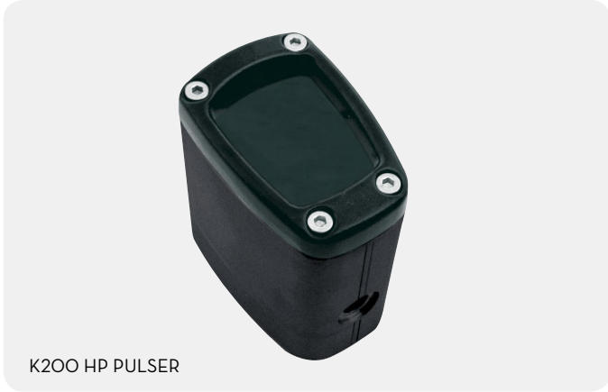
K200 HP PULSER