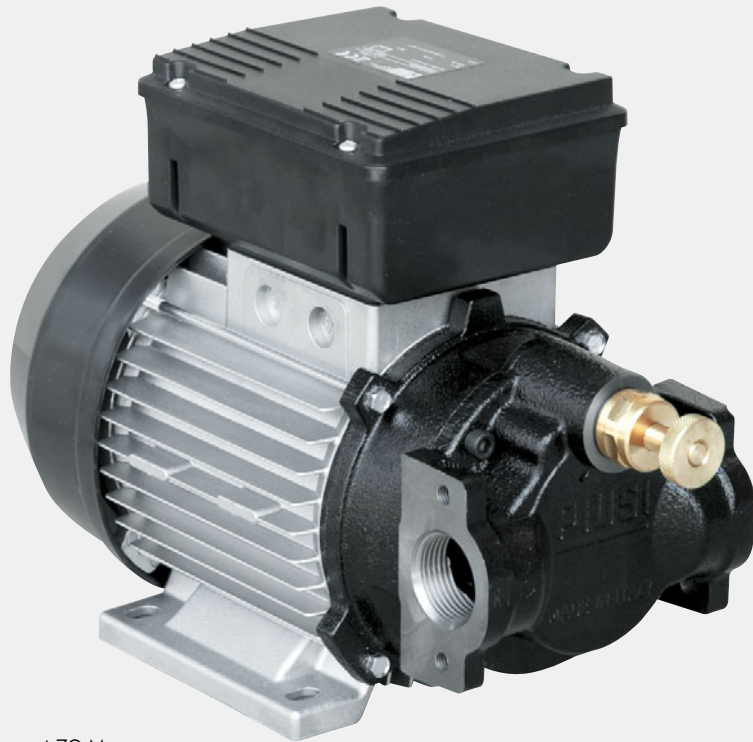
Viscomat 70 M