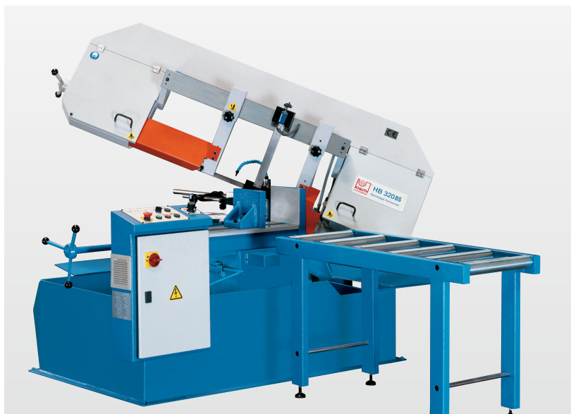
HB 320 BS с поворотной на 60° рамой и рольгангом