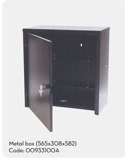
Metal box (565x308x582) Code: 00933100A