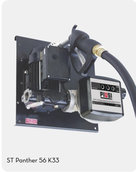
ST Panther 56 K33