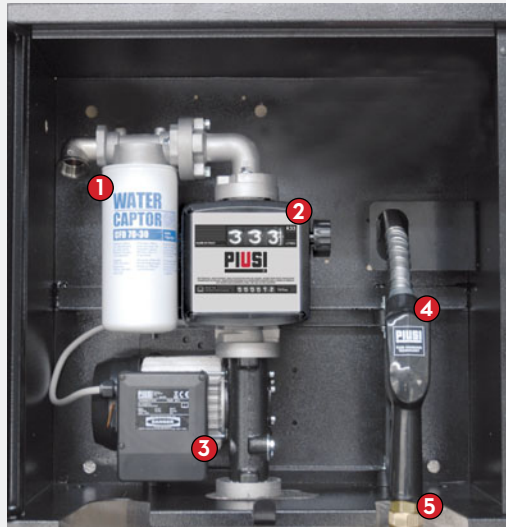
ST BOX Basic