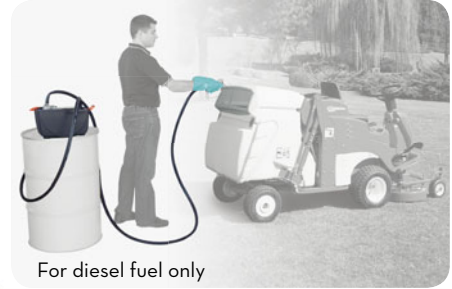
For diesel fuel only