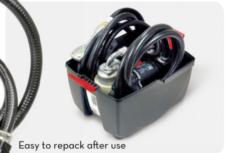
Easy to repack after use