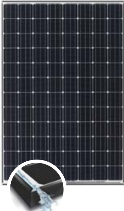
Уникальная дренажная система