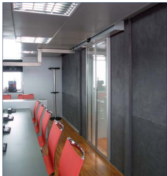
Scuderia Toro Rosso