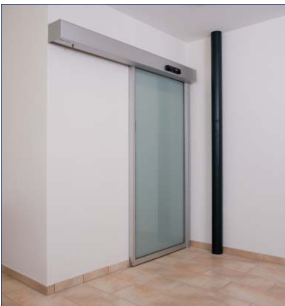
Hubertus Hotel Schluchsee