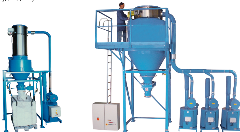
от 5.5 до 44 кВт

делают доступным вакуум на рабочих местах, позволяют оперативно и без пыления возвращать в производство технологическое сырье. Благодаря системе трубопроводов с производительностью, рассчитанной для конкретного производства, вакуумная очистка производится на большом удалении от вакуумного агрегата (источника вакуума), что позволяет проводить уборку на различных этажах и в труднодоступных местах.