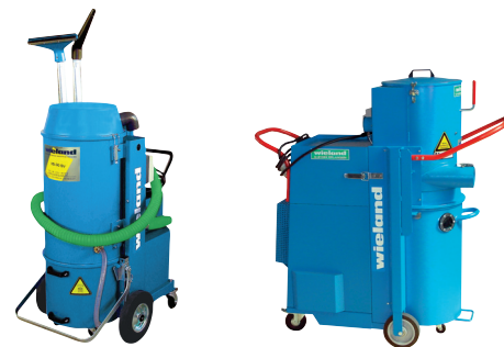
IS-30 SV, 3 кВт

Передвижные промышленные пылесосы. Wieland предлагает и дорогие и малобюджетные агрегаты для вакуумной уборки помещений, очистки производственного оборудования и высокоскоростного пылеудаления.