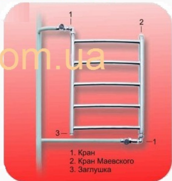
1. Последовательное подключение к ГВС

(возможно только для труб \varnothing не больше 1/2)