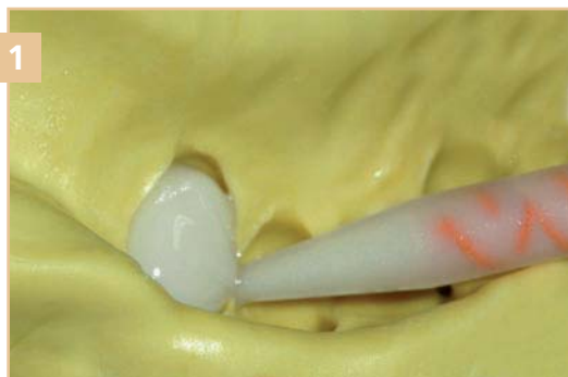
1 Нанесение ACRYTEMP на внутреннюю поверхность оттиска препарированной культи