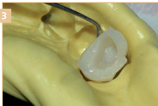
3 Удаление временного элемента из оттиска после застывания