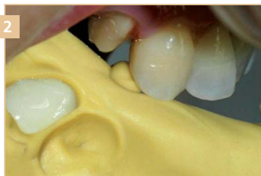
Переустановка оттиска на культе