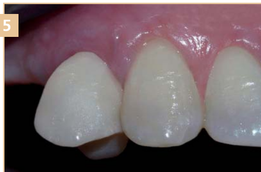
5 Окончательная версия работы