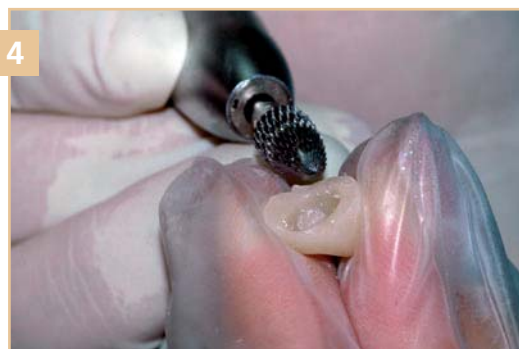
Финишная обработка временного элемента из ACRYTEMP