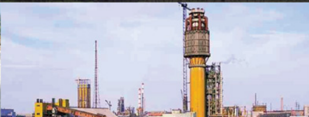
ПАО «Концерн Стирол»