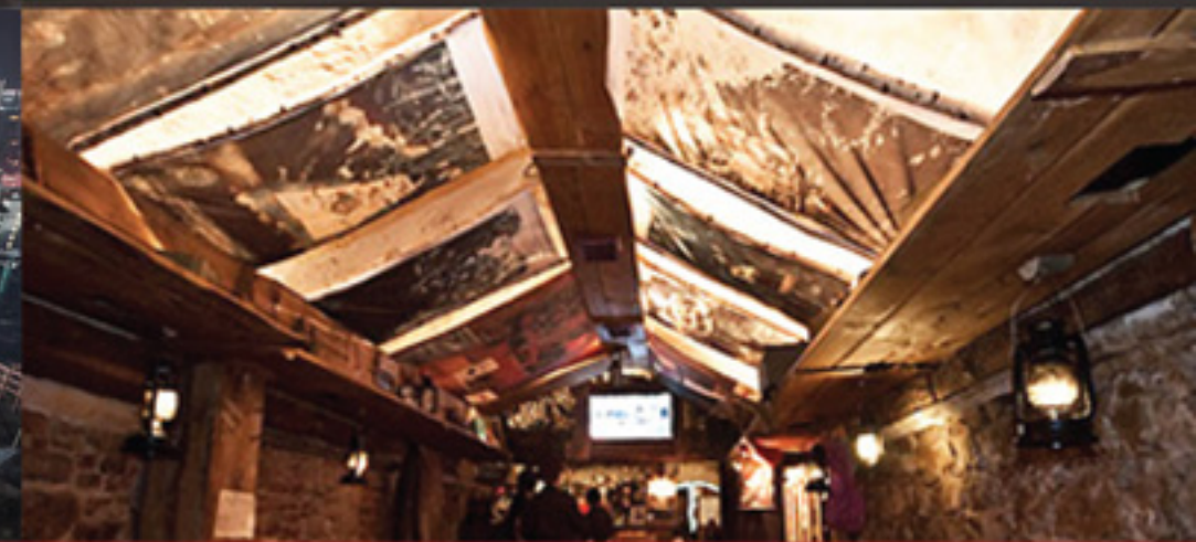
Ресторан «Криївка», г. Львов

Низковольтное оборудование, арматура СИП и изделия для прокладки кабеля