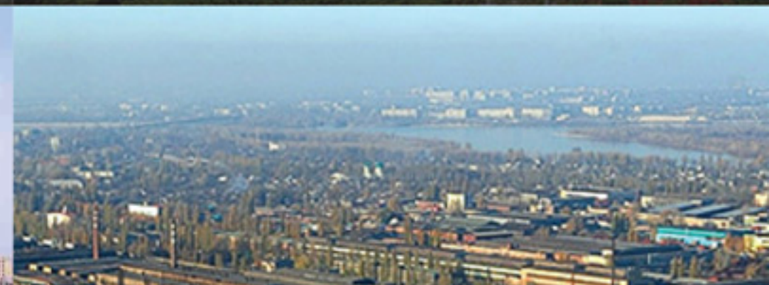
ОАО «Кременчугский сталелитейный завод»