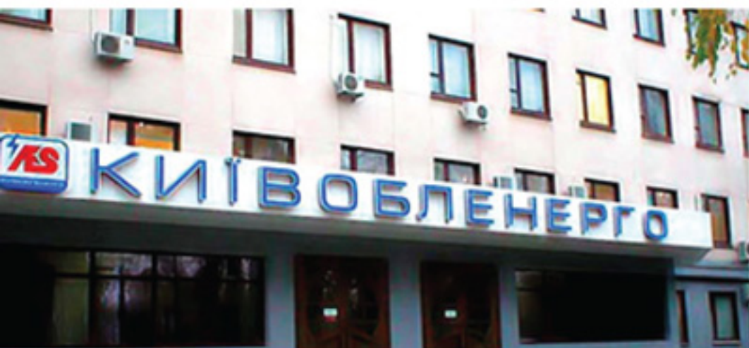
ПАО «А.Э.С. Киевоблэнерго»