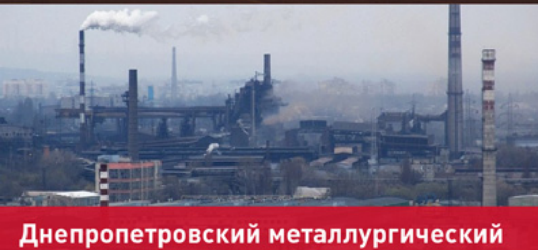
Днепропетровский металлургический завод им. Петровского

Низковольтное оборудование и арматура для СИП