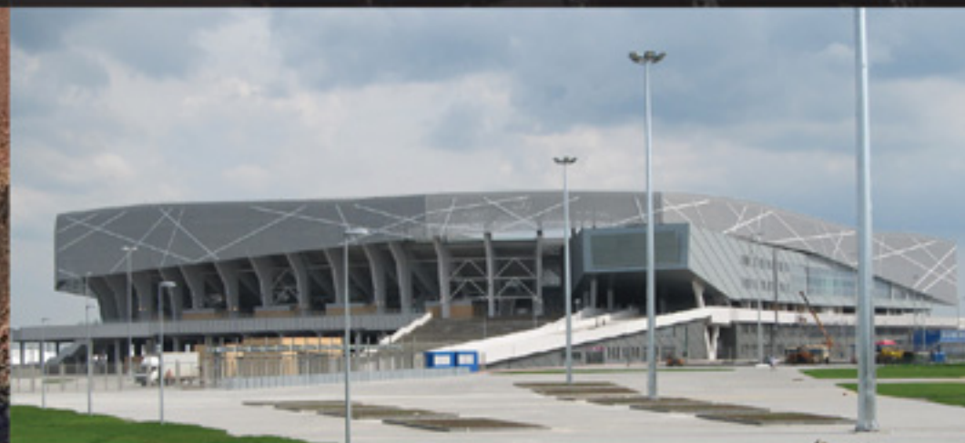
Стадион «Арена Львов»

Листовые перфорированные и неперфорированные лотки