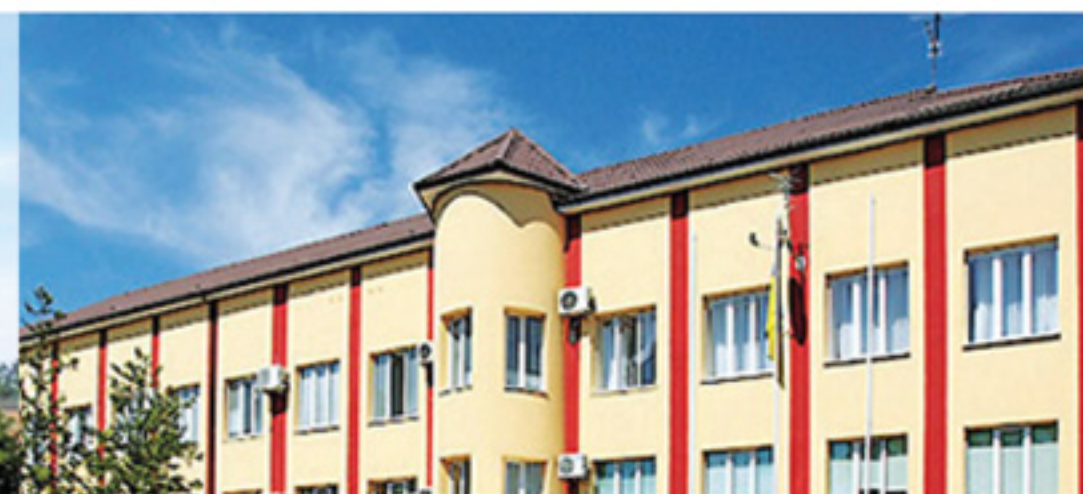
ОАО ЭК «Закарпатьеоблэнерго»

Арматура для СИП и низковольтное оборудование