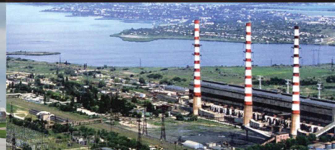
ЗАО «Молдавская ГРЭС»

Сетчатые, листовые перфорированные и неперфорированные лотки