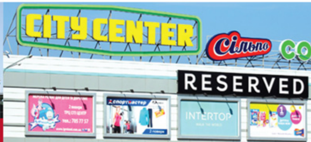
ТРЦ «City Center», г. Одесса