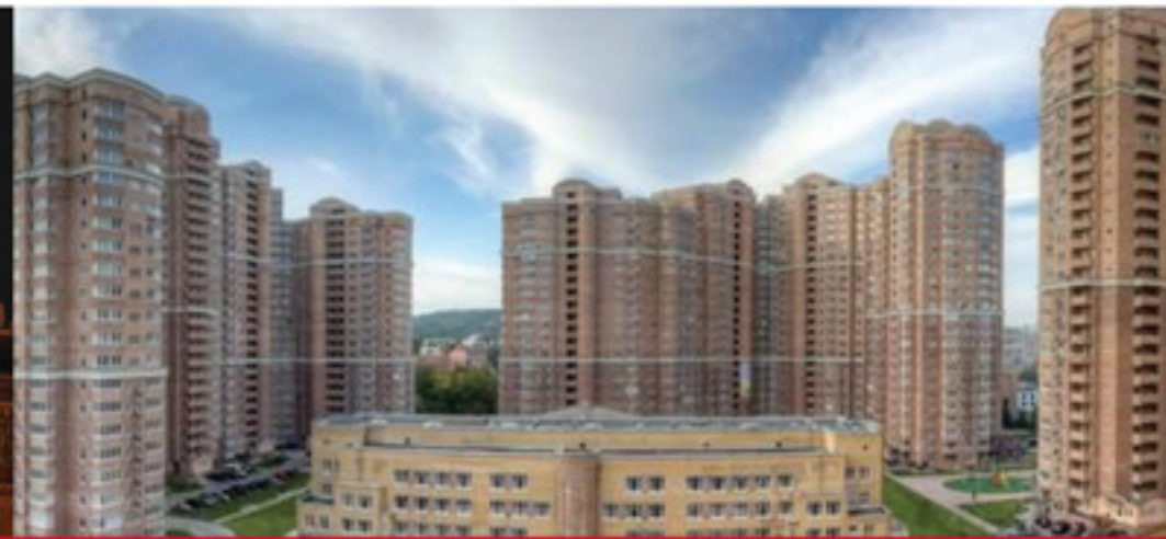
Жилой комплекс «Голосеево»

Низковольтное оборудование и изделия для монтажа