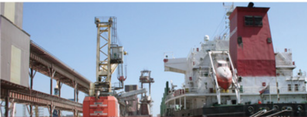
Морской специализированный порт Ника-Тера