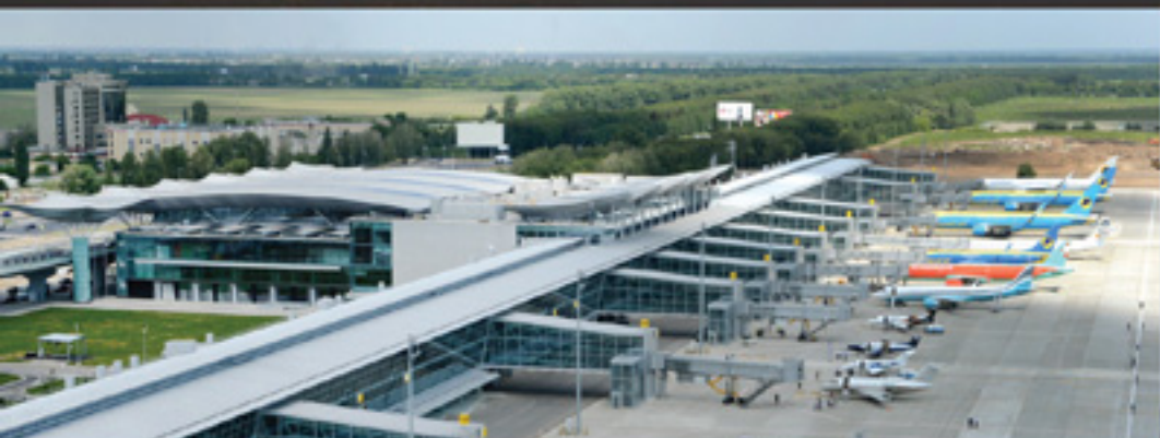
ГП «Международный аэропорт «Борисполь»

Арматура для СИП и низковольтное оборудование