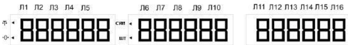
Мал.2 Розташування індикаторів