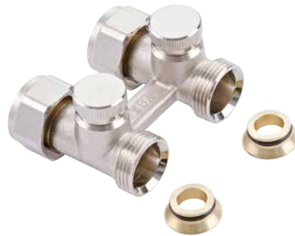
[760-001-07] Набор прямых подключений со втулками для подключения