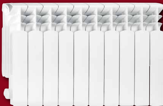
Тип радиатора: G 350 F

Максимальная рабочая температура составляет 95°C Максимальное рабочее давление 16 бар.