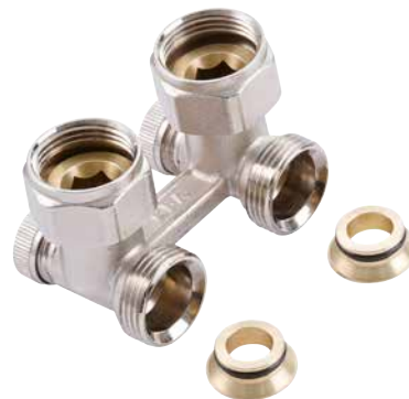
[760-101-07] Набор угловых подключений со втулками для подключения