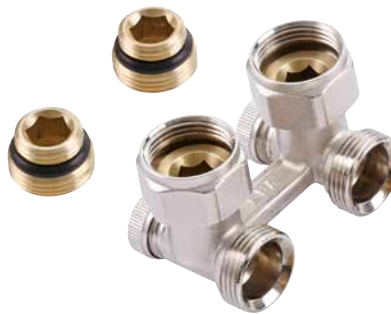
[760-100-07] Набор угловых подключений с радиаторными ниппелями