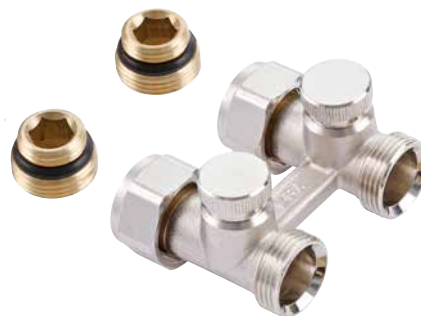
[760-000-07] Набор прямых подключений с радиаторными ниппелями