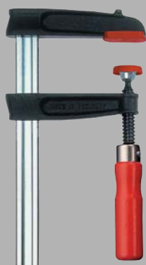
Струбцина из ковкого чугуна TPN с надежной деревянной ручкой