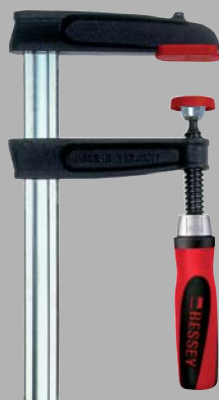
Струбцина из ковкого чугуна TPN с двухкомпонентной рукояткой из пластика