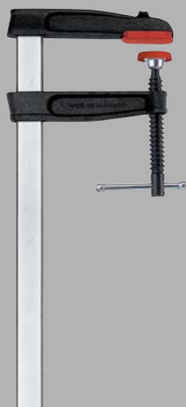
Струбцина из ковкого чугуна TRC с Т-образной ручкой