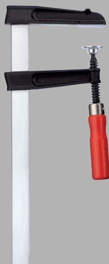
Струбцина из ковкого чугуна TGKR с надёжной деревянной ручкой