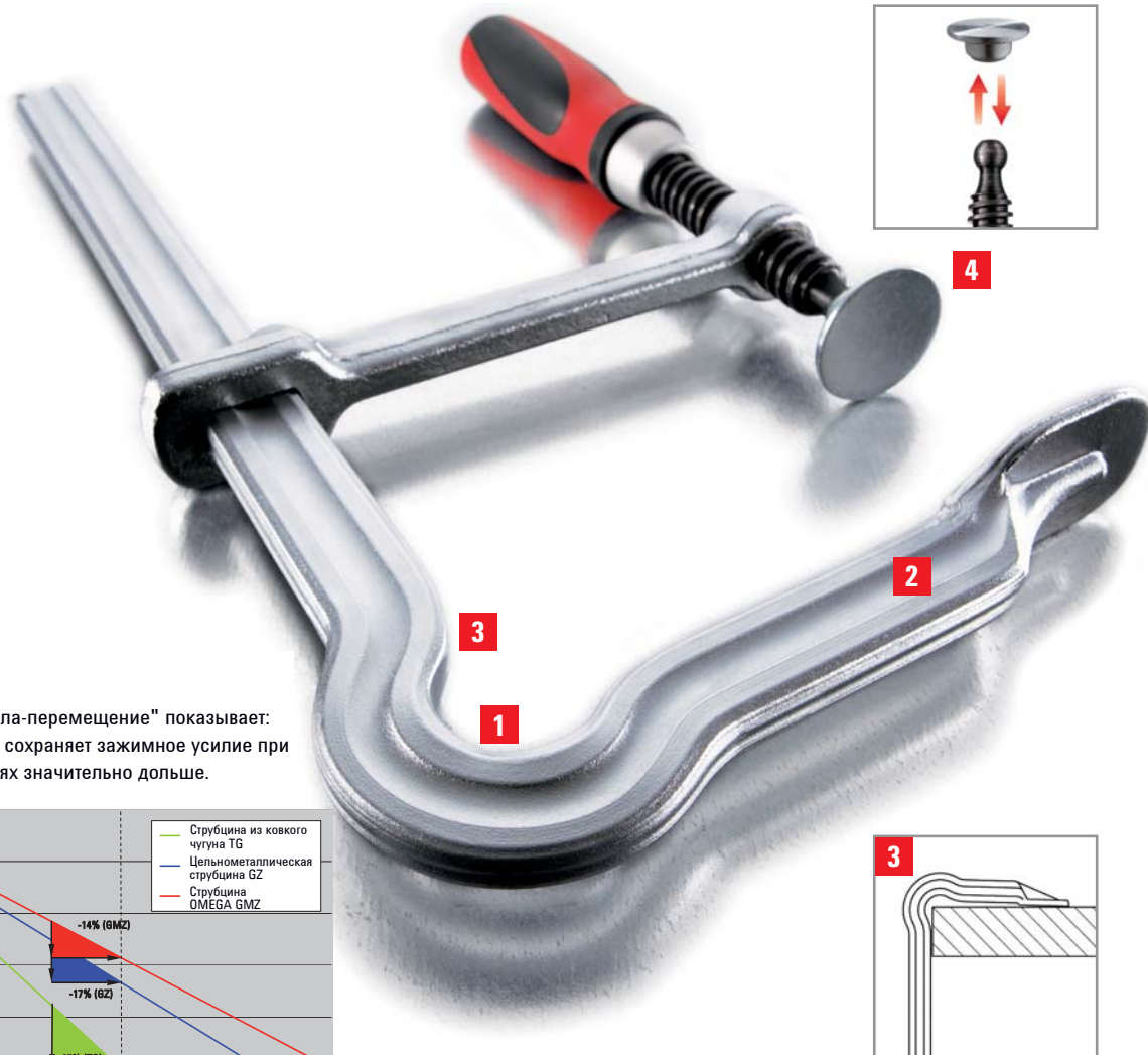
Диаграмма "сила-перемещение" показывает: струбцина OMEGA сохраняет зажимное усилие при вибрациях значительно дольше.