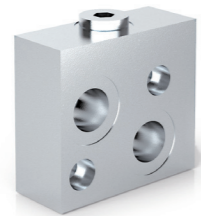
TIPO/TYPE VSBF OMP/OMS