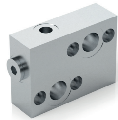
TIPO/TYPE VSBF OMS