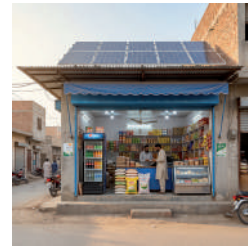
Для малого бізнесу