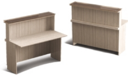
3467 грн. 3765 грн. 4029 грн. 11.09.14 11.09.16 11.09.18 L 1400; L 1600; L 1800; W 750; H 1224