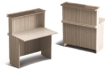
2521 грн. 2769 грн. 3016 грн. 11.09.08 11.09.10 11.09.12 L 800; L 1000; L 1200; W 750; H 1224