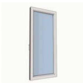
Склеювання для часткового посилення стулок із різною геометрією