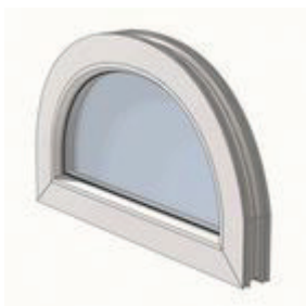
Склеювання профілів, що не мають сталевих вставок (армування)