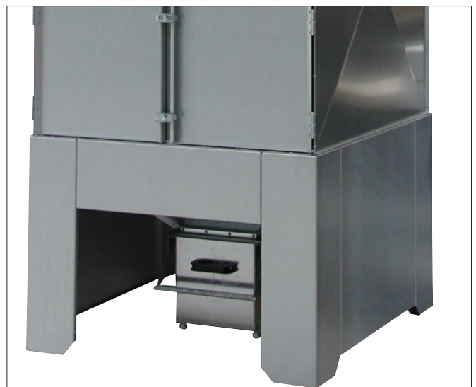
Вежа GFB2 з посиленою конструкцією та стандартним баком.