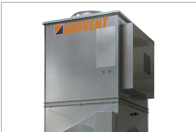
Вентилятор, встановлений зверху у вбудованій шафі.