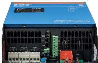
Зона підключення MultiPlus-II 4k5