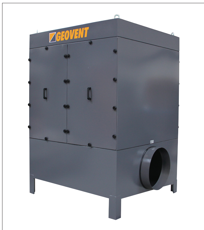
Geofilter GFO 500