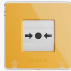
ManualCallPoint (Yellow) Jeweller