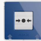
ManualCallPoint (Blue) Jeweller