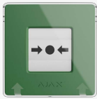
ManualCallPoint (Green) Jeweller