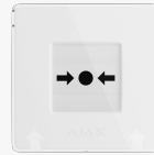
ManualCallPoint (White) Jeweller