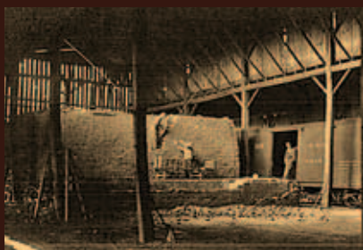
строительство печи (XIX век),