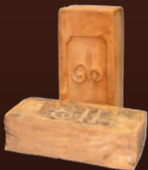
NF 250x120x65 мм