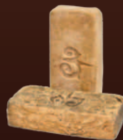
WF 210x100x50 мм