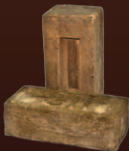
WDF 210x100x65 мм