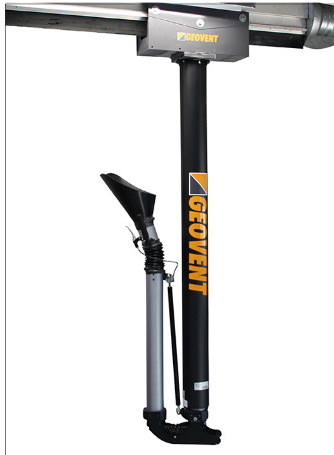
Smart Exhaust Arm

Канальний повітропровід - див. тех. паспорт