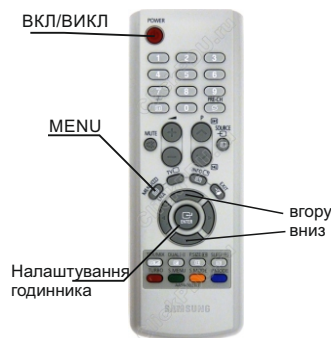
ІЧ - ПУЛЬТ: AA59-00332A