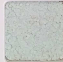
35 G OP, SG, SIG, Σ, O