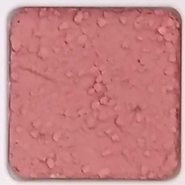
17 D OP, SG, SIG, Σ, O