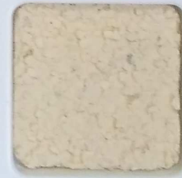
27 G OP, SG, SIG, Σ, O