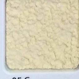
05 G OP, SG, SIG, Σ, O