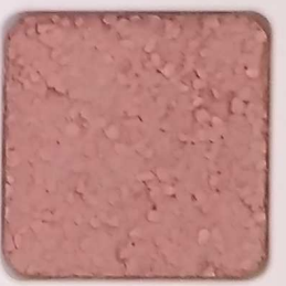
18 D OP, SG, SIG, Σ, O