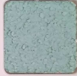
35 D OP, SG, SIG, Σ, O