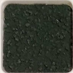
36 A ■▲*10- OP, SIG