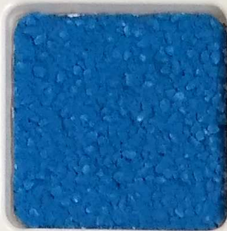
40 A ■▲*10 OP, SIG