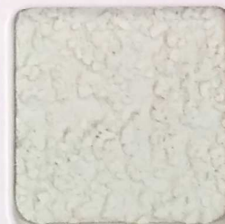
33 G OP, SG, SIG, Σ, O