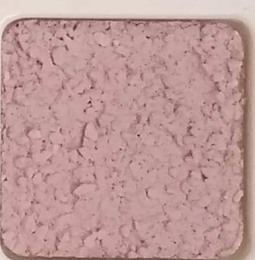
43 D OP, SG, SIG, Σ, O