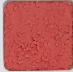
14 B ■10-