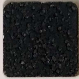
39 A ■▲*10- OP, SIG