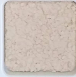
26 G OP, SG, SIG, Σ, O