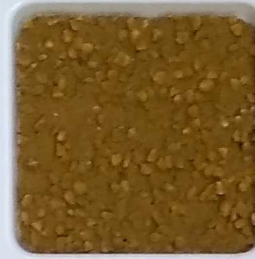
25 A ■▲*10- OP, SIG