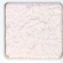
16 G OP, SG, SIG, Σ, O