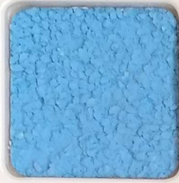
40 B ■10