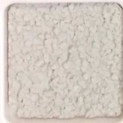
36 G OP, SG, SIG, Σ, O