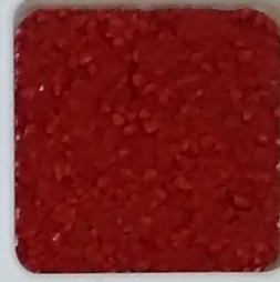
15 A ■▲*10- OP, SIG