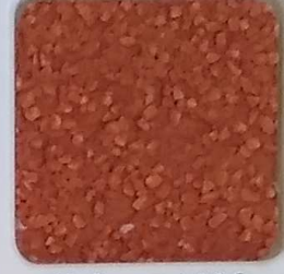
11 A ■▲*10- OP, SIG