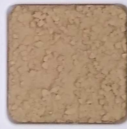
26 D OP, SG, SIG, Σ, O