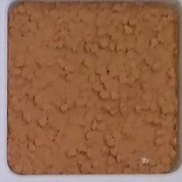
07 B ■10-