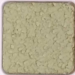
29 D OP, SG, SIG, Σ, O