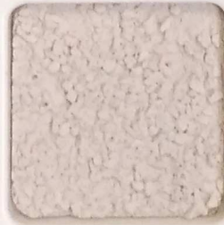
37 G OP, SG, SIG, Σ, O