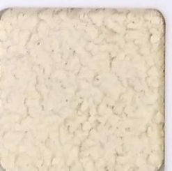
28 G OP, SG, SIG, Σ, O