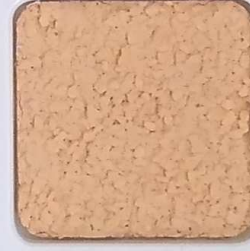
10 D OP, SG, SIG, Σ, O