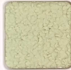
32 D OP, SG, SIG, Σ, O