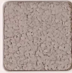
37 D OP, SG, SIG, Σ, O