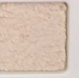
19 G OP, SG, SIG, Σ, O