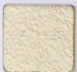
03 G OP, SG, SIG, Σ, O