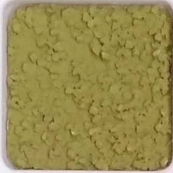
28 B ■10-