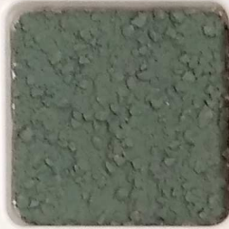
36 B ■10-