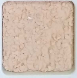
22 G OP, SG, SIG, Σ, O