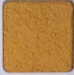
06 B ■10-