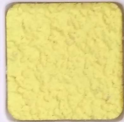
02 D OP, SG, SIG, Σ, O