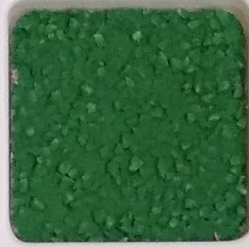
34 A ■▲*10- OP, SIG