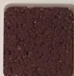
43 A ■▲*10 OP, SIG