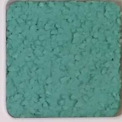
35 B ■10-