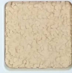
21 G OP, SG, SIG, Σ, O