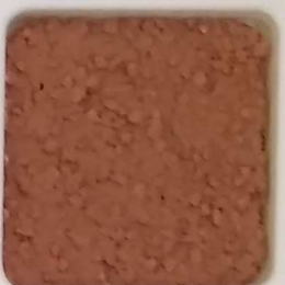
19 B ■10-