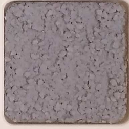
39 D OP, SG, SIG, Σ, O