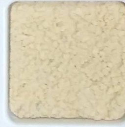
25 G OP, SG, SIG, Σ, O