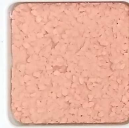
12 D OP, SG, SIG, Σ, O