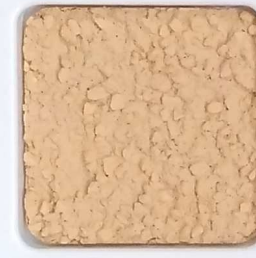
20 D OP, SG, SIG, Σ, O