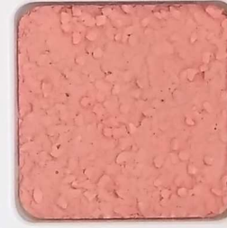
13 D OP, SG, SIG, Σ, O