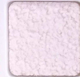
01 D OP, SG, SIG, Σ, O