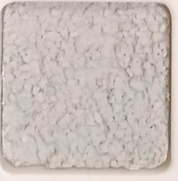
41 G OP, SG, SIG, Σ, O