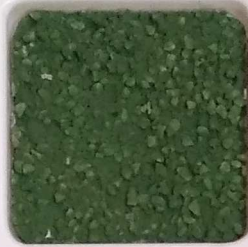
33 A ■▲*10- OP, SIG