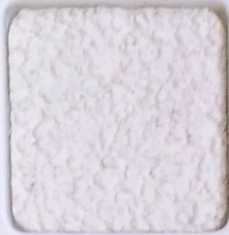
01 A OP, SG, SIG, Σ, O