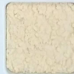
09 G OP, SG, SIG, Σ, O