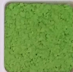
31 B ■10-