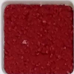
16 A ■▲*10- OP, SIG