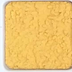
08 D OP, SG, SIG, Σ, O