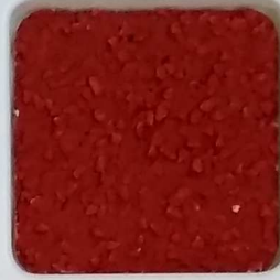
14 A ■▲*10- OP, SIG