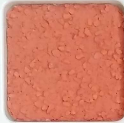
12 B ■10-