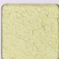
30 G OP, SG, SIG, Σ, O