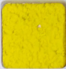
02 A ■▲*10 OP, SIG