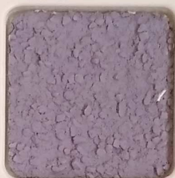
42 B ■10