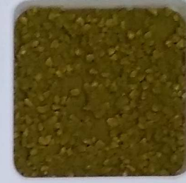
27 A ■▲*10- OP, SIG