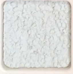
40 G OP, SG, SIG, Σ, O