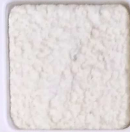
01 B OP, SG, SIG, Σ, O