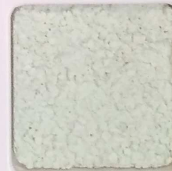
34 G OP, SG, SIG, Σ, O