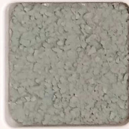
36 D OP, SG, SIG, Σ, O