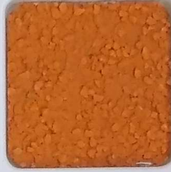
10 A ■▲*10- OP, SIG