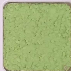
31 D OP, SG, SIG, Σ, O