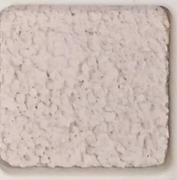
43 G OP, SG, SIG, Σ, O