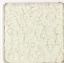
32 G OP, SG, SIG, Σ, O