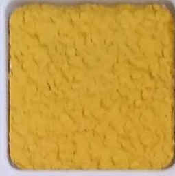
05 B ■10-