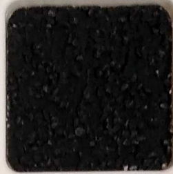
38 A ■▲*10- OP, SIG