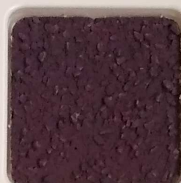
42 A ■▲*10 OP, SIG