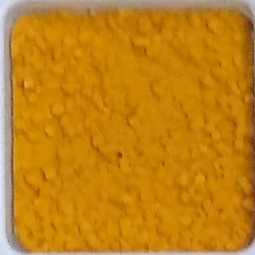
04 A ■▲*10- OP, SIG