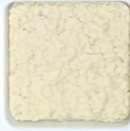
24 G OP, SG, SIG, Σ, O