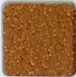
20 A ■▲*10 OP, SIG