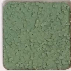
33 B ■10-