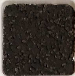
37 A ■▲*10- OP, SIG