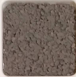
37 B ■10-