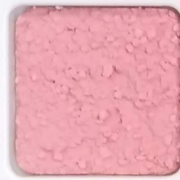
16 D OP, SG, SIG, Σ, O