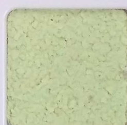
31 G OP, SG, SIG, Σ, O