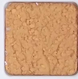
21 D OP, SG, SIG, Σ, O