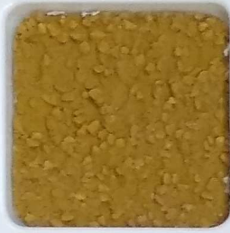
24 A ■▲*10- OP, SIG