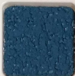
41 A ■▲*10 OP, SIG