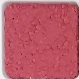
16 B ■10-