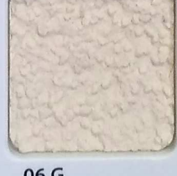
06 G OP, SG, SIG, Σ, O