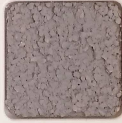
38 D OP, SG, SIG, Σ, O