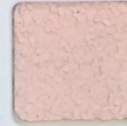
14 G OP, SG, SIG, Σ, O