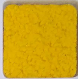
03 A ■▲*10 OP, SIG