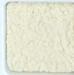
08 G OP, SG, SIG, Σ, O