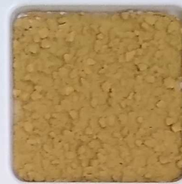
25 B ■10-