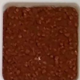
19 A ■▲*10- OP, SIG