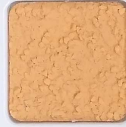
09 D OP, SG, SIG, Σ, O