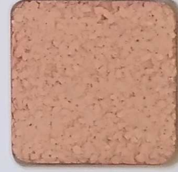
11 D OP, SG, SIG, Σ, O