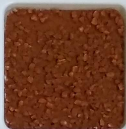
22 A ■▲*10 OP, SIG