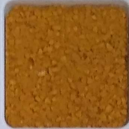
06 A ■▲*10- OP, SIG