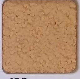
07 D OP, SG, SIG, Σ, O