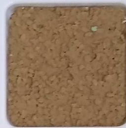
26 B ■10-