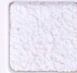
01 F OP, SG, SIG, Σ, O