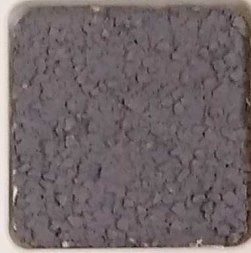
38 B ■10-