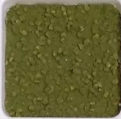
28 A ■▲*10- OP, SIG