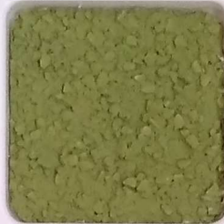
29 B ■10-