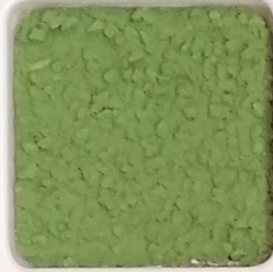
32 B ■10-