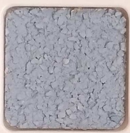
41 D OP, SG, SIG, Σ, O