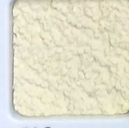
04 G OP, SG, SIG, Σ, O