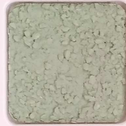
33 D OP, SG, SIG, Σ, O