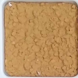
20 B ■10