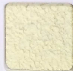
02 G OP, SG, SIG, Σ, O