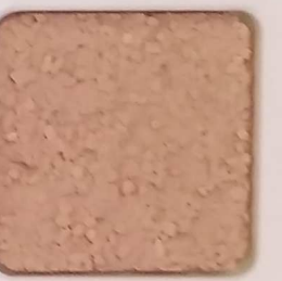
19 D OP, SG, SIG, Σ, O