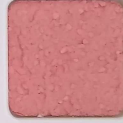
15 D OP, SG, SIG, Σ, O