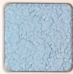
40 D OP, SG, SIG, Σ, O