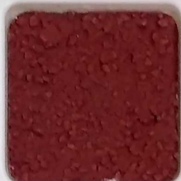
17 A ■▲*10- OP, SIG