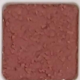
18 B ■10-