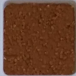
07 A ■▲*10- OP, SIG