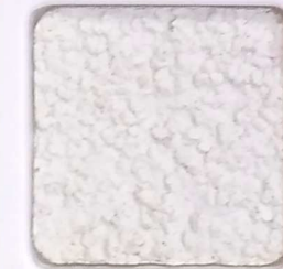
01 E OP, SG, SIG, Σ, O