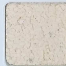
10 G OP, SG, SIG, Σ, O