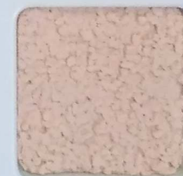
11 G OP, SG, SIG, Σ, O