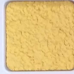
04 D OP, SG, SIG, Σ, O