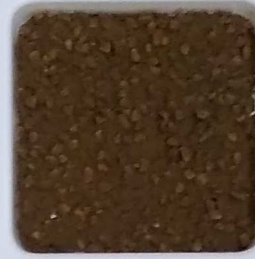
26 A ■▲*10- OP, SIG