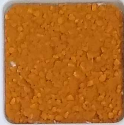
09 A ■▲*10- OP, SIG