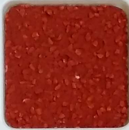
13 A ■▲*10- OP, SIG