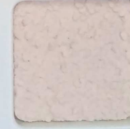
15 G OP, SG, SIG, Σ, O