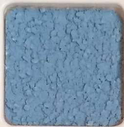
41 B ■10