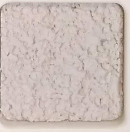
42 G OP, SG, SIG, Σ, O