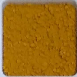
05 A ■▲*10- OP, SIG