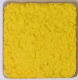
03 B ■10