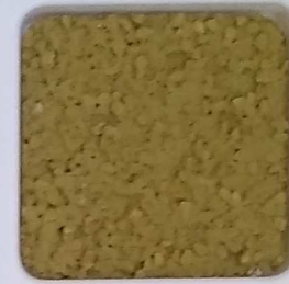
27 B ■10-