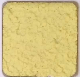
03 D OP, SG, SIG, Σ, O