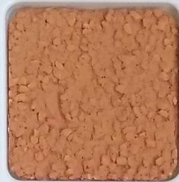
21 B ■10