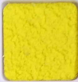
02 B ■10