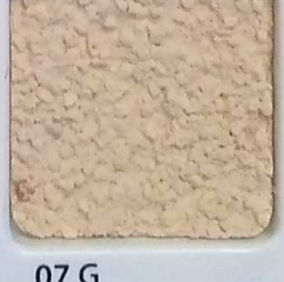
07 G OP, SG, SIG, Σ, O