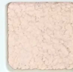
12 G OP, SG, SIG, Σ, O