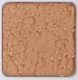
22 D OP, SG, SIG, Σ, O