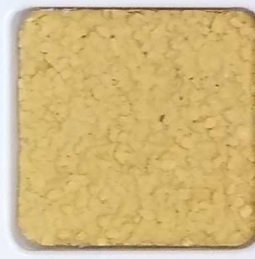
24 D OP, SG, SIG, Σ, O