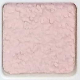
17 G OP, SG, SIG, Σ, O