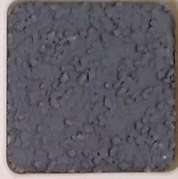
39 B ■10-