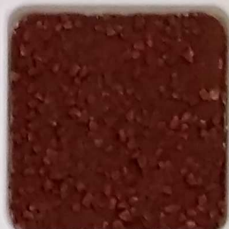
18 A ■▲*10- OP, SIG