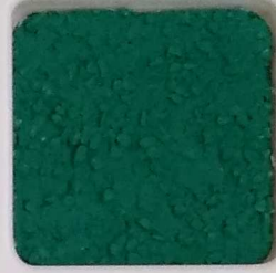
35 A ■▲*10- OP, SIG