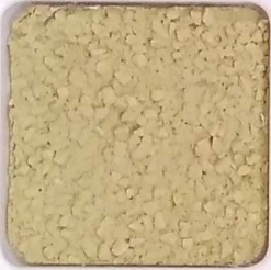
28 D OP, SG, SIG, Σ, O