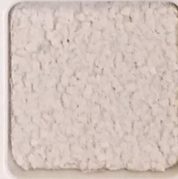
38 G OP, SG, SIG, Σ, O