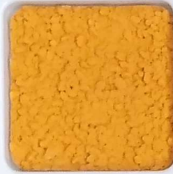
08 B ■10-