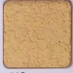
06 D OP, SG, SIG, Σ, O