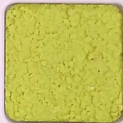
30 D OP, SG, SIG, Σ, O