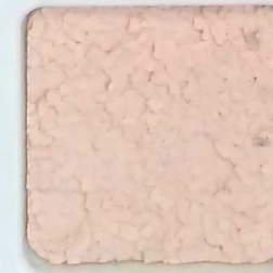
13 G OP, SG, SIG, Σ, O