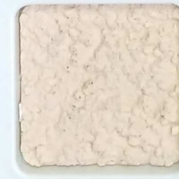
20 G OP, SG, SIG, Σ, O