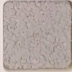
39 G OP, SG, SIG, Σ, O