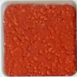
12 A ■▲*10- OP, SIG