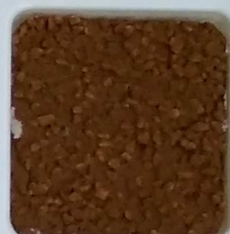
23 A ■▲*10 OP, SIG