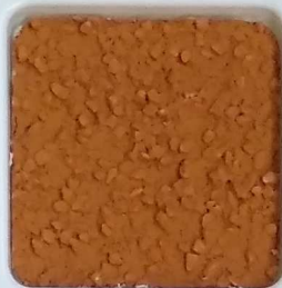
21 A ■▲*10 OP, SIG