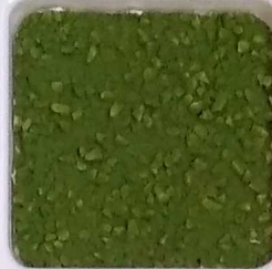
29 A ■▲*10- OP, SIG