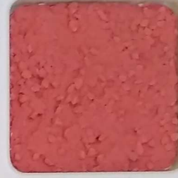
15 B ■10-