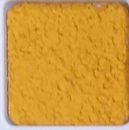
04 B ■10-