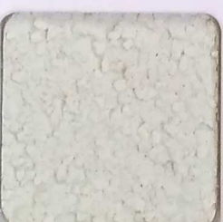
29 G OP, SG, SIG, Σ, O