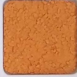
10 B ■10-