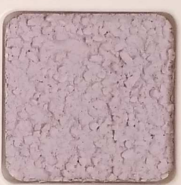
42 D OP, SG, SIG, Σ, O