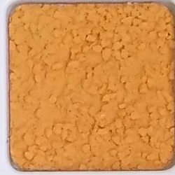
09 B ■10-