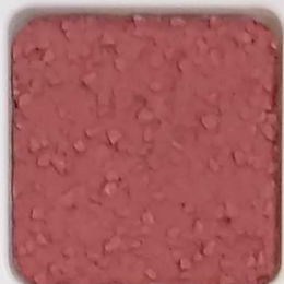
17 B ■10-