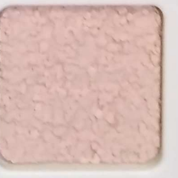
18 G OP, SG, SIG, Σ, O