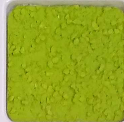
30 A ■▲*10- OP, SIG