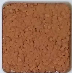
22 B ■10