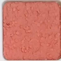
13 B ■10-