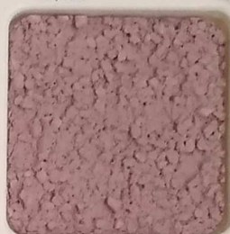
43 B ■10