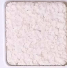
01 C OP, SG, SIG, Σ, O