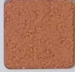
11 B ■10-