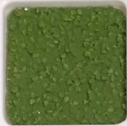
32 A ■▲*10- OP, SIG