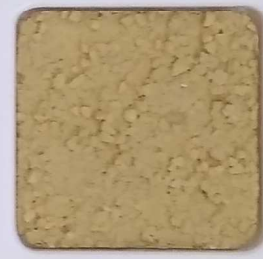
27 D OP, SG, SIG, Σ, O