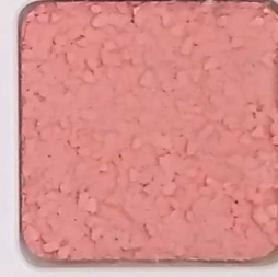
14 D OP, SG, SIG, Σ, O