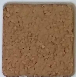
23 B ■10