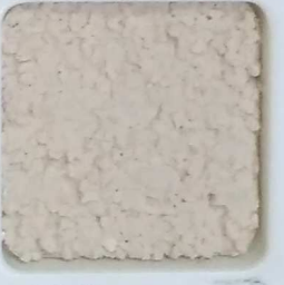
23 G OP, SG, SIG, Σ, O