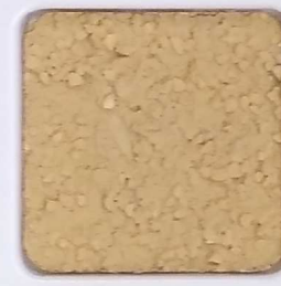
25 D OP, SG, SIG, Σ, O