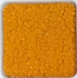
08 A ■▲*10- OP, SIG