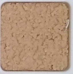
23 D OP, SG, SIG, Σ, O