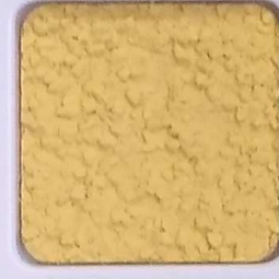
05 D OP, SG, SIG, Σ, O