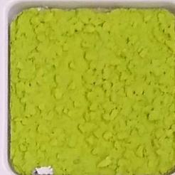
30 B ■10-