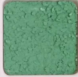
34 B ■10-