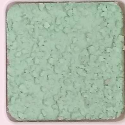
34 D OP, SG, SIG, Σ, O