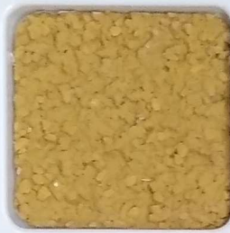
24 B ■10-