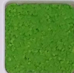
31 A ■▲*10- OP, SIG