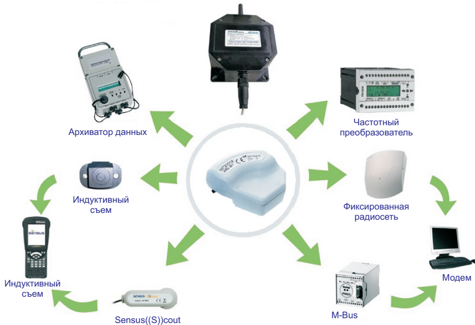
HRI-P импульсный модуль