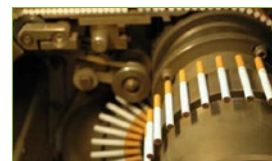
Фабрики з виробництва сигарет