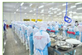
Підприємства продуктів харчування