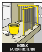
МОНТАЖ БАЛКОННИХ ПЕРИЛ