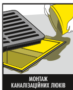
МОНТАЖ КАНАЛІЗАЦІЙНИХ ЛЮКІВ