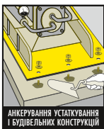
АНКЕРУВАННЯ УСТАТКУВАННЯ І БУДІВЕЛЬНИХ КОНСТРУКЦІЙ