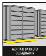
МОНТАЖ ВАЖКОГО ОБЛАДНАННЯ