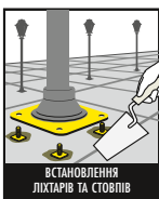
ВСТАНОВЛЕННЯ ЛІХТАРІВ ТА СТОПІВІВ