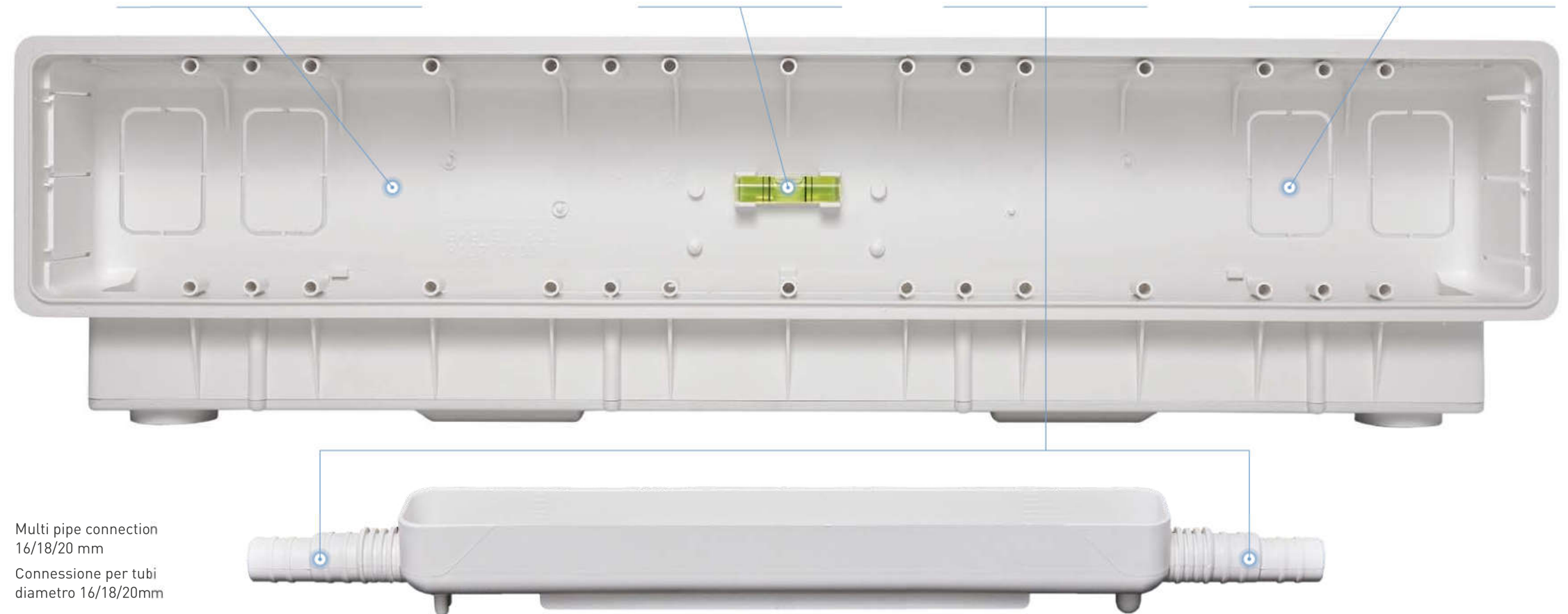
Multi pipe connection 16/18/20 mm Connessione per tubi diametro 16/18/20mm

Predisposizione all'uscita della tubazioni lateralmente o posteriormente.