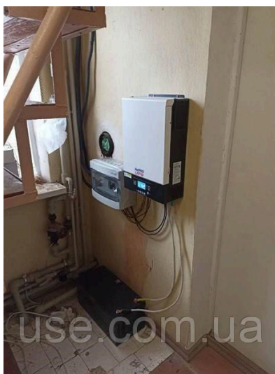
Phaeton 5000 (5000W, 48V гібридний / on-line)

Інвертор 48 Вольт, 5000 Вт, гібридний, з правильною синусоїдою, джерело, блок, безперебійного, резервного, гарантованого, живлення, гібридний, MPPT, on-line, online, перетворення, подвійного перетворення, з вмонтованим АВР, однофазний, для резервування живлення, дому, офісу, квартири, складу, будівлі, дому, кімнати, дачі, побутового обладнання, електрообладнання, кухонної техніки, дизельгенератора, бензогенератора.