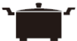
Каструля з ніжками