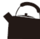
Чайник з нержавіючої сталі або емальований