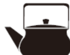
Посуд зі сплаву з низьким вмістом заліза