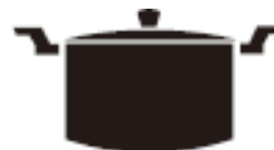
Каструля з випуклим дном