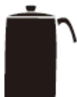
Зовнішній діаметр менше 12 см