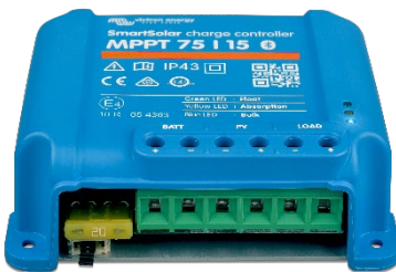
Контроллер заряда SmartSolar MPPT 75/15