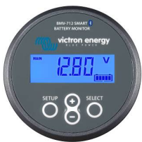
Bluetooth считывание BMV-712 Smart Battery Monitor