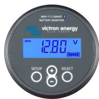
Bluetooth считывание: BMV-712 Smart Battery Monitor