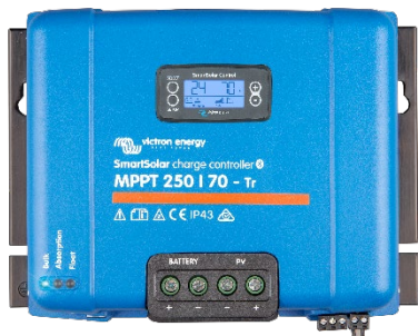
Контроллер заряда SmartSolar MPPT 250/70-Tr с опциональным подключаемым экраном