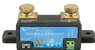
Датчик Bluetooth: SmartShunt