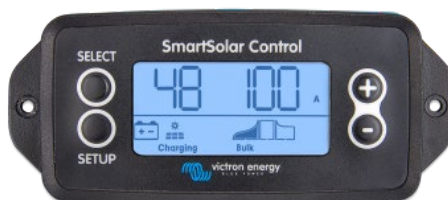
SmartSolar pluggable display