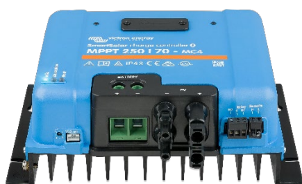
Контроллер заряда SmartSolar MPPT 250/70-MC4 без экрана