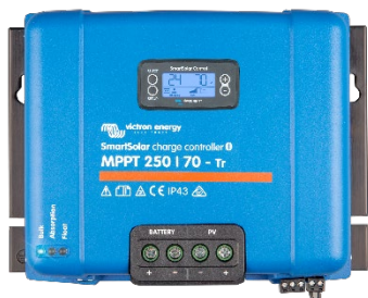
Контролер заряду SmartSolar MPPT 250/70-Tr з додатковим дисплеєм