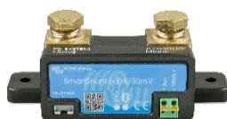
Пристрій SmartShunt з підтримкою Bluetooth