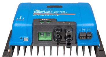
Контролер заряду SmartSolar MPPT 250/70-MC4 без дисплея