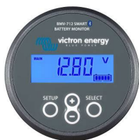
Батарейний монітор BMV-712 Smart Battery Monitor з підтримкою Bluetooth