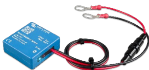
Бездротовий датчик Smart Battery Sense з підтримкою Bluetooth