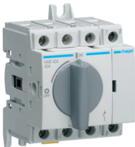
Вимикач навантаження поворотний 400/690В 40А, 4п, 3.5м