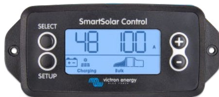
Подключаемый экран SmartSolar

Просто снимите резиновую заглушку, которая закрывает разъем спереди контроллера и вставьте кабель монитора.