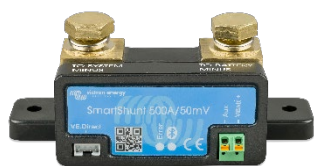
Датчик Bluetooth: SmartShunt