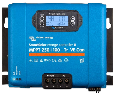
Контроллер заряда SmartSolar MPPT 250/100-Tr VE.Can с опциональным подключаемым экраном