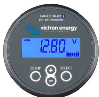
Bluetooth-датчик: BMV-712 Smart Battery Monitor