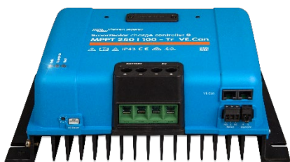
Контроллер заряда SmartSolar MPPT 250/100-Tr VE.Can без экрана