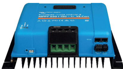
Контролер заряду SmartSolar MPPT 250/100-Tr VE.Can без екрану