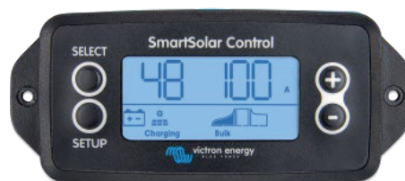
Екран SmartSolar, що підключається