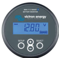
Батарейний монітор BMV-712 Smart з функцією Bluetooth