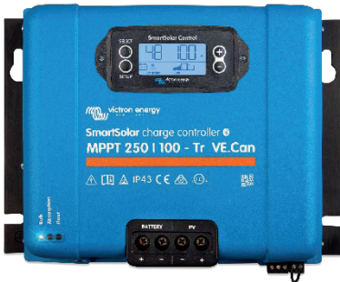
Контролер заряду SmartSolar MPPT 250/100-Tr VE.Can з опціональним екраном, що підключається